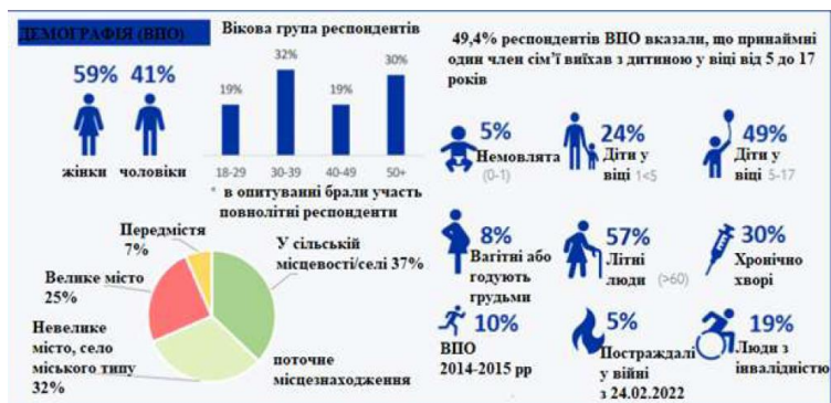
Рис. 1. Демографічна структура ВПО витрат (70%), зокрема на продовольство, а третина взяла по-зику [2].

Значно гірші наслідки для України має виникнення зовнішнього біженства. У багатьох європейських країнах збільшиться кількість біженців. Ситуація в Україні демонструє одне з найбільших та найшвидших (1 млн людей залишає країну щотижня) переселень з часів Першої світової війни. На даний момент кількість українських переселенців до інших країн досягла 4 млн чоловік. Якщо чоловікам дозволять покидати кордони України, це число збільшиться втричі [4, с. 5].